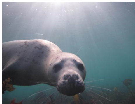
Gegroet, Scapa Flow duikers 2012

Zonder dat je het verwacht is het onderwaterleven ook nog eens mooi in het koude water van maar 12 graden. Zeehonden, hondshaaien (slechts twee van ons hebben ze gezien) en "pinguïns" op 20 meter diepte (Jan van Gent vogels).