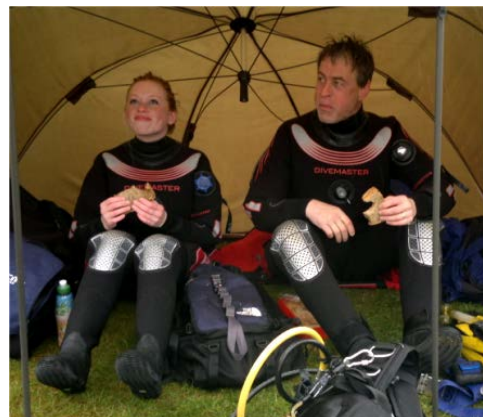
Vooraf ook logistieke taken worden aan de Divemaster toebedeeld.