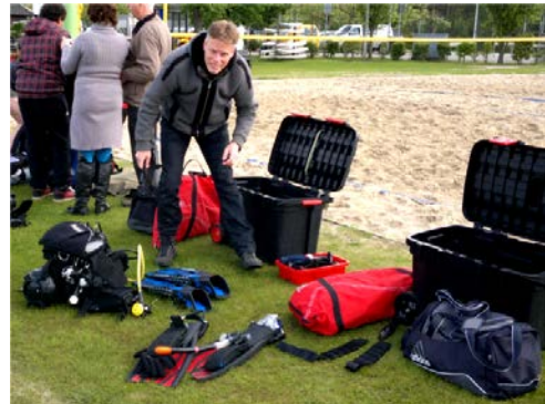
Een Divemaster heeft altijd overzicht.

Een Divemaster vervult vooral ook een voorbeeld functie.